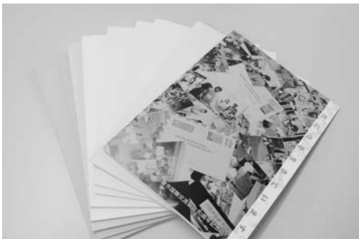
過去に発行された「人に会う旅」と10周年記念誌

他の記念事業として、平成4年に始まり第15回で中断した「人に会う旅～フィリピン・ピナトゥボ地域との交流～」を、久しぶりにフィリピンの友だちに会いたいとの会員の皆様のご要望にお応えするため、再度「人に会う旅」を計画しています。ピナトゥボ地域との交流は現在も協会からのボランティア派遣事業で継続していますが、皆さんも心の故郷ピナトゥボへ帰ってみませんか!? 時期等の詳細は今後のお知らせをお楽しみに！