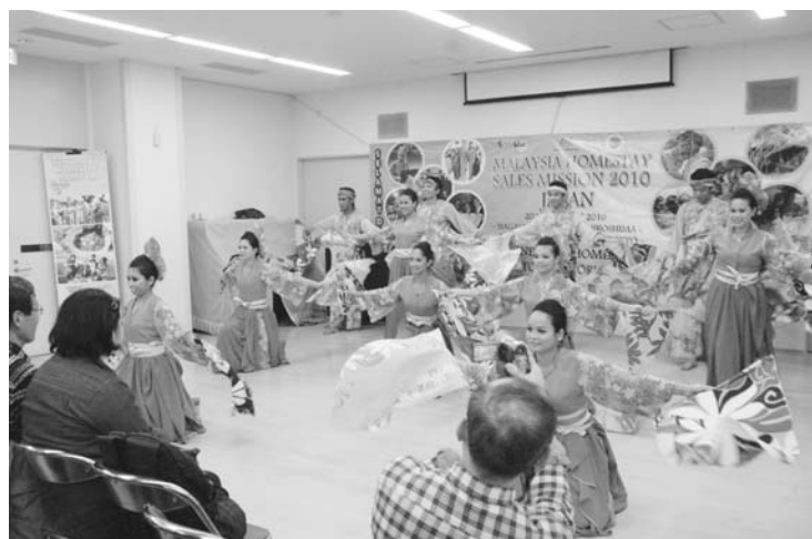
マレーシアのタベ in 岩倉の様子