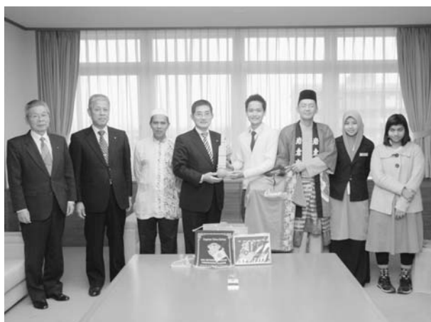
市長との記念写真

○楽しかったことは？ 「言葉が通じずお互いが身振り手振りで懸命に分かり合おうとしたこと。」「子どもが必死で英語でコミュニケーションしようとしている姿をみたこと。」「ゲーム(ウノ、トランプ)、プリクラ。」「一緒に買い物に行き、たこ焼きを作ったこと。」「一宮タワーへクリスマスイルミネーションを見に行ったこと。」「いつもどおりの生活をし、いつもの生活より楽しく感じられたこと。」