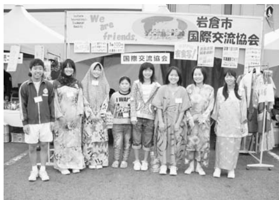
今年も中学生の皆さんが手伝ってくれました。

またボランティアに来てくれた中学生の皆さんにマレーシアの民族衣装を着てもらい協会PRのお手伝いをしていただきました。