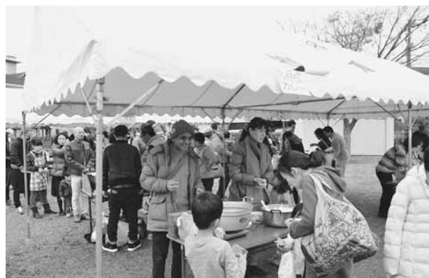
▲当日は寒く、バングラディッシュのカレーなど温かいものが人気でした。