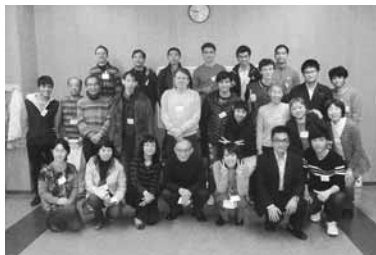
▲最後にみんなで記念撮影

日頃の机上の勉強だけではなく、楽しみながら生きた日本語の勉強ができたひとときでした。