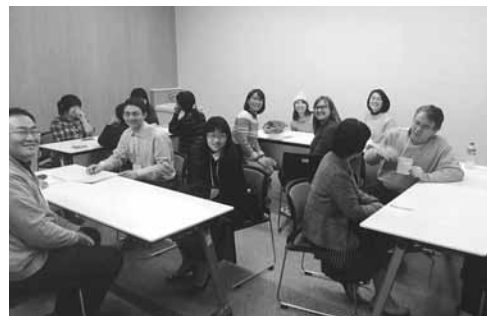
▲1月の会の様子。みんな楽しく英語で会話をしました。