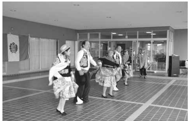
▲ペルーのダンスを皮切りにスタート！