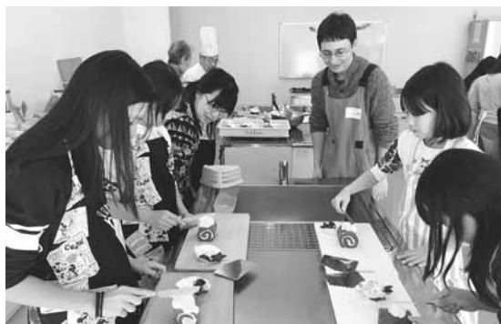
▲みんな、うまくできたかな?

して、世界にただ一つのブッシュ・ド・ノエルを完成させました。ケーキ作りの後は、ダスティン先生からカナダのクリスマスの様子を教えてもらったり、クリスマスソングを一緒に歌ったり、飛び出すクリスマスカードを作ったりして楽しいひとときを過ごすことができました。自分で作ったブッシュ・ド・ノエルと心のこもったカードで素敵なクリスマスを迎えられたのではないのでしょうか。