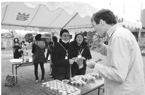
▲カナダのカップケーキはおいしいと好評でした。

世界各地の民族料理が一堂に会する岩倉版食のオリンピック「地球まるごと食べちゃおう」。5回目となる今回は、12月6日(日)に開催されました。天候にも恵まれ300人を超える来場者がありました。ご来場ありがとうございました。皆さんからは「美味しかった。」「来年もやってほしい。」等の感想をいただきました。