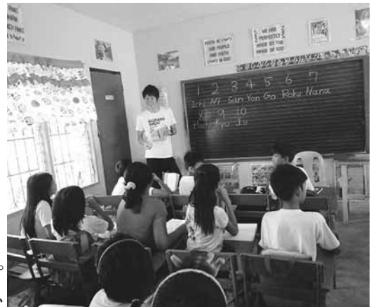
小学校で日本語を教えてきました！

翌週からボランティア活動が始まり、僕は複数の小学校に出向き、生徒達と日本について話し合ったり、遊んだりしました。そこでは、一人一冊ずつ教科書を持てる状況ではなく、また1クラス60人の教室もありました。これでは教育も行き届かないと思いました。貧富の差も激しく、決して裕福とは思えないこの地域でも、町の方では子どもたちがスマホを使い、村の方では裸足で教室に入る。こんなギャップに驚きました。それでも、どの子ども達も真面目に取り組んでくれて、本当にいい子ばかりでした。