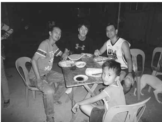
温かく迎え入れてくれたホスト家族との団らん

現地の人々は僕を温かく歓迎してくれ、とても楽しい日々を過ごすことができました。ご飯は手で食べるのが普通で、どの料理もおいしくて、たくさんおかわりもしました。結果、僕の体重は3kg増えました！