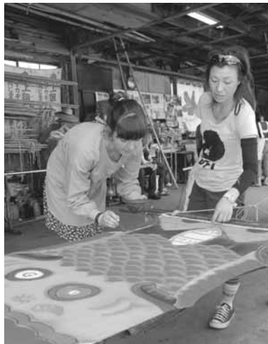
こいのぼりづくりを楽しむ ゲストとホストファミリー

岩倉市国際交流協会では海外からのゲストを受け入れていただけるホストファミリーを大募集しています。言葉も違えば文化も違う異国の人とふれあうチャンス！1泊から長期滞在まで内容はいろいろです。各ご家庭のスケジュールに合わせてご紹介させていただきます。まずはホストファミリーとして登録してみませんか？ご興味のある方はぜひ下記までお問い合わせください。きっと心と心がつながる素敵な体験が待っています♡