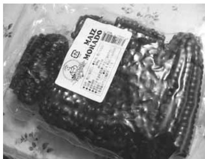
材料のパープルコーン

総会終了後のティーパーティーでペルーの代表的飲み物のチチャ・モラーダを参加者の皆さんに味わっていただきました。材料のパープルコーンには、ポリフェノールがいっぱいです。