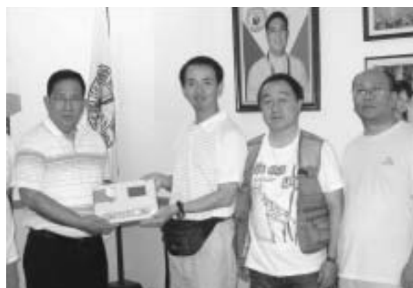
フロリダブランカ市長に ECG を贈呈

ECGの現物を確認し、いろんな人が秘書室を出入りするのを見ながら、しばらくの間市長を待つ。ようやく市長が到着し、ECG贈呈の記念写真も撮って、「今回の任務、一つ終了！」と思ったら、明日の市役所の朝礼で贈呈式を行うとのこと（…また任務が増えた）。その後、タイクスのお墓参り。通りには、大晦日に打ち上げる花火を売っている屋台がいっぱい。