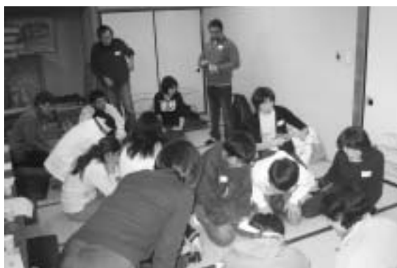
新年会でのカルタ取り

「学習者もスタッフも楽しく！」をモットーに、学習者がそれぞれ必要とする日本語を習得できるよう、スタッフ一同頑張っています。日本語支援に興味のある人は、ぜひ一度、気軽に教室を覗いてみてください。