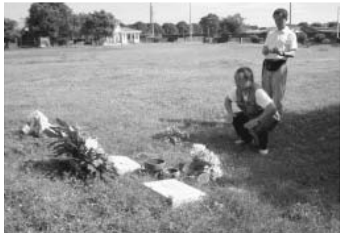
タイクスのお墓参り

最後に、多くの皆様からECG購入のための募金を寄せていただきました。心から感謝申し上げます。（文：山田日出雄）