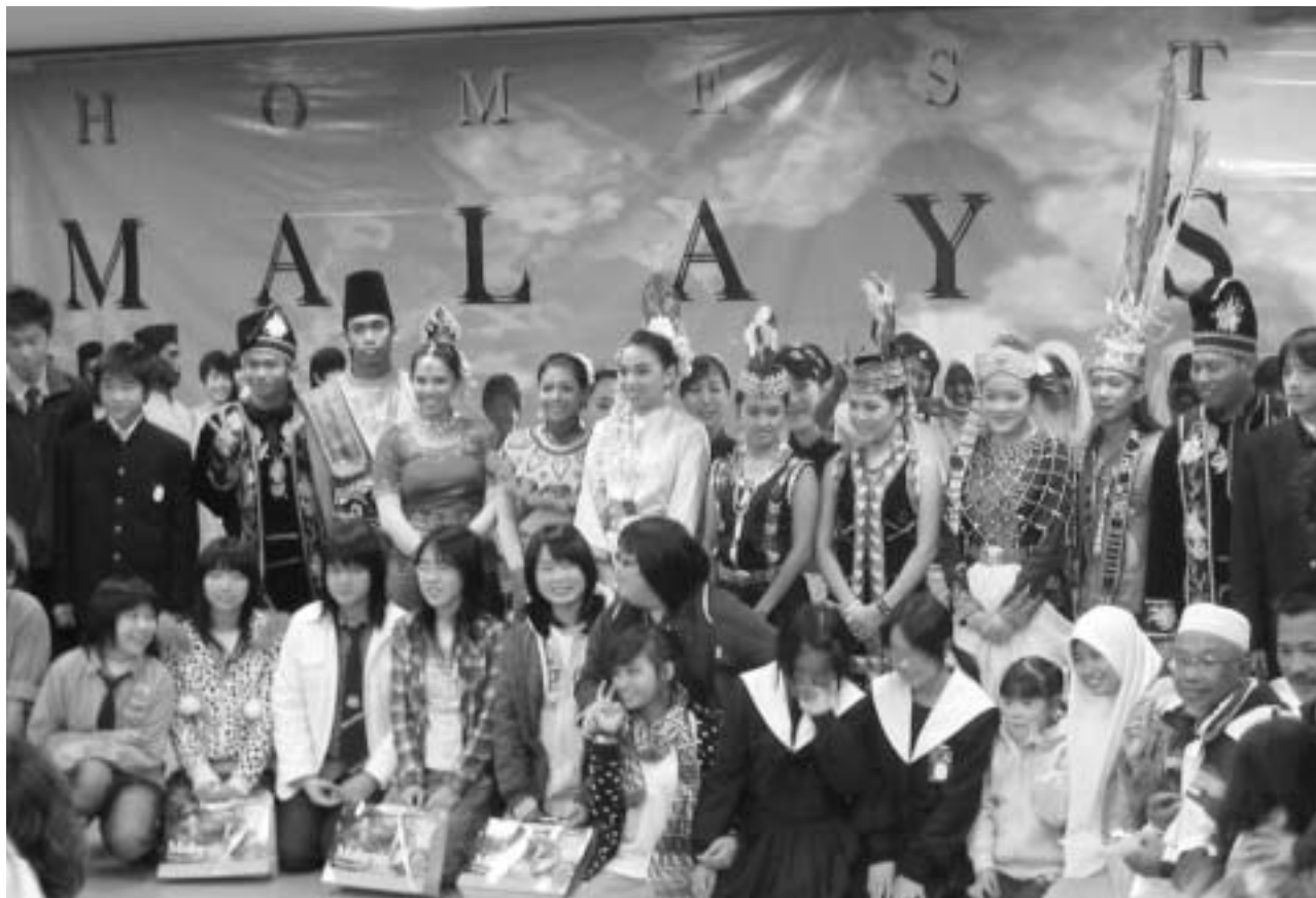
希望の家でホスト、ゲスト、ダンサーたちが一緒になって記念撮影

点灯式が行われた日の夕方は、とても寒くなりましたが、ダンサーたちは、常夏のマレーシアの衣装で(裸同然の人も)最後まで頑張って踊り、記念撮影にも笑顔を振りまいてくれました。