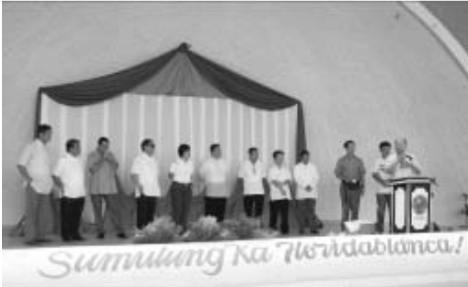
フロリダブランカ市役所朝礼でのあいさつ

帰りは、大渋滞のマニラ市街を通り抜け、フィリピン航空 PR438 便に搭乗（機内は空いていた。まあ、30日に帰る人たちはいないだろうなあ）。予定より30分程早くセントレアに到着。